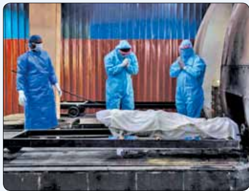
بستگان یک در گذشته کرونا در دهلی نو پیش از سوزاندن جسد دعا می کنند.