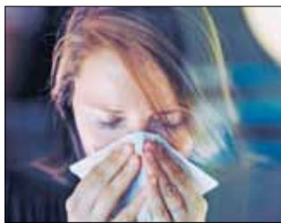
روز پس از عفونت بروز می کند. افرادی که

علائم در حالی صورت می گیرد که پزشکان شناخت بیشتری از بیماری کووید-۱۹ به دست می آورند و مراقبت از بیماران دچار شکل شدید بیماری بهتر شده است. با این حال CDC هنوز علائم پوستی به صورت ضایعات ارغوانی رنگ در انگشتان پاهای بیماران (پای کووید) را به فهرست علائم اضافه نکرده است. علائم کووید-۱۹ از ۲ تا ۱۴ روز پس از عفونت با ویروس کرونا و در اغلب موارد در حدود ۴ تا ۵