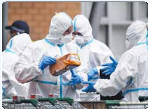
آشنانشان در ملبورن به فرقیته شدن غذا می رسانند.