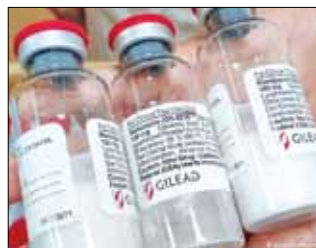
۵۳۰۰۰ نفر از جمله ۴۰۰۰ فردی که آزمایش

ویروس کرونا نشان مثبت شده بود، وارد این بررسی کرده بودند. افرادی که سابقه مصرف یکبار در روز این داروها را داشتند، ۲ برابر بیشتر در معرض خطر عفونت با ویروس کرونا قرار گرفته بودند و در افرادی که ۲ بار در روز از این قرص ها مصرف می کردند، خطر عفونت با ویروس کرونا ۳ برابر افرادی بود که این داروها را مصرف نمی کردند. نتایج این بررسی در مجله گاستروانترولوژی آمریکا منتشر شده است. در این تحقیق بیماران