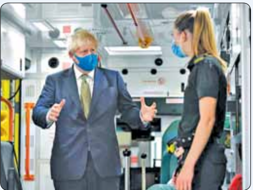
نخست وزیر بریتانیا با یک پرستار در مرکز آمبولانس لندن صحبت می کند.