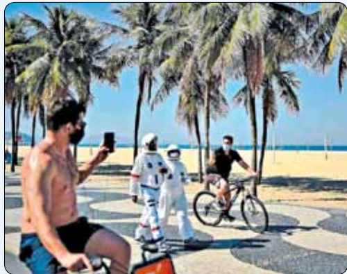
زوجی با لباس محافظ در ساحل روی دو ژانیترو در برزیل قدم می زنند.