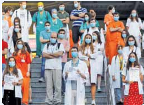
کارورزان پزشکی در مادرید برای بهبود شرایط کاری اعتراض می کنند.