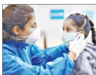
بیشترشان دارای بیماری زمینه ای هستند. این گروه همچنین دریافتند که بیش از ۶۰ درصد از کودکان با آزمایش مثبت کرونا نیاز به درمان در

بیمارستان و ۸ درصدشان نیاز به مراقبت ویژه پیدا کرده بودند. از ۵۸۲ کودک مورد بررسی، فقط ۴ کودک مردند. از طرف دیگر، ۹۰ کودک یا ۱۶ درصد هیچ علامتی را نشان ندادند. به گفته این پژوهشگران عمده کودکان و افراد کم سن فقط بیماری خفیف را تجربه می کنند. با این وجود، شمار قابل توجهی از کودکان دچار بیماری شدیدی می شوند و نیاز به مراقبت ویژه دارند. این موضوع را باید هنگام برنامه ریزی و اولویت بندی منابع مراقبت بهداشتی با پیشرفت همه گیری باید در نظر داشت. شایع ترین علائم میان کودکان در این بررسی تب (۶۵ درصد) بود